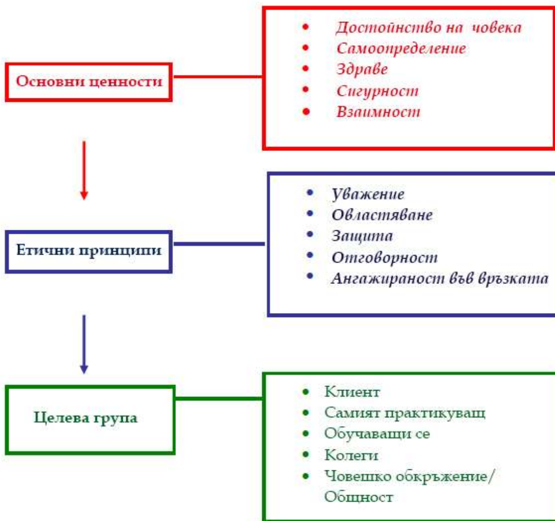
Фиг. 1. Синтез на сърцевината на етичния кодекс – три равнища на анализ на етичното практикуване